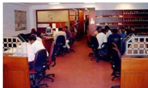
Immer mehr Schweizer Unternehmen arbeiten mit indischen Übersetzungsbüros zusammen.