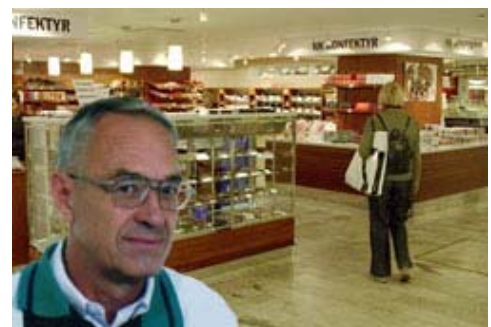
Fargate-Satellit MFR vor einem Schaufenster der Ladenkette NK Konfektyr in Stockholm, inzwischen einer der grössten Abnehmer von Läderach-Pralinen in Schweden.