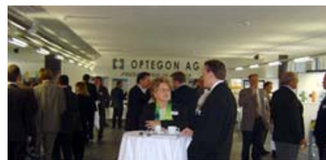
Dritte Ausgabe der Schweizer Präsenzbörse: Donnerstag, 21. Oktober 2004 von 9:00 bis 17:00 Uhr im Technopark Luzern.