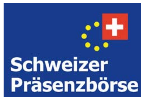
Treffpunkt von Unternehmern und Private Equity Investoren