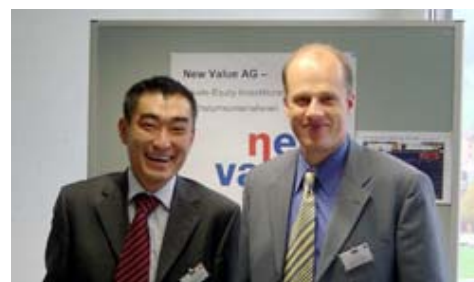
Internationales Publikum: Investoren wie Unternehmer stammen aus der Schweiz, Deutschland und Österreich.