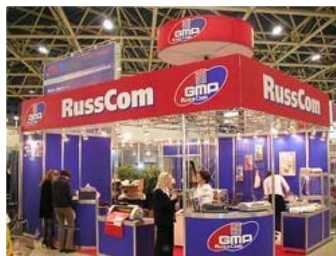
Die russische Geschäftswelt hat sich dem Westen geöffnet: Internationale Messe «IT-Week Expo 2004» in Moskau mit 250 Ausstellern aus 25 Ländern und 75'000 Besuchern.