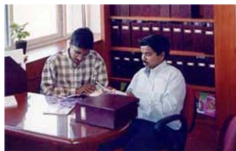
Die Löhne von indischen Übersetzern liegen bei gleicher Qualität bei rund 25 Prozent des europäischen Niveaus.