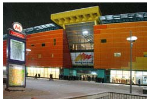
Kommunismus ade! Das neu eröffnete Kaluzhskoy in Moskau: Mit neun Sälen das grösste Multiplex-Kino Russlands.

➔ Vollständiger Bericht (vgl. Internet-Archiv)